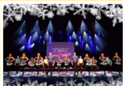
Danceperados of Ireland