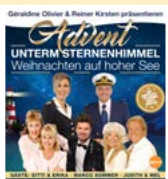
Advent unterm Sternenhimmel