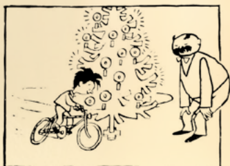
Auszug aus der Bildgeschichte „Weihnachtsbescherung“